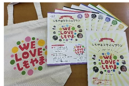
▲全戸に配布される、しもやまスマイルプランの分野別・自治区別概要版とエコバック。

しもやま支所だよりは豊田市ホームページからも見ることが出来ます。 http://www.city.toyota.aichi.jp/