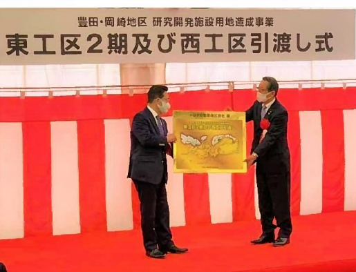
▲引き渡し式の様子

3月24日(水)下山代町で、自動車の研究開発などを目的とした造成事業(豊田・岡崎地区研究開発施設用地造成事業)の引渡し式が行われました。