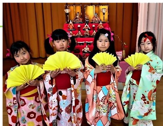
▲東部こども園のひな祭り会の様子

東部こども園では、始めに先生から、ひな祭りについて話を聞いた後、らいおん組（年長児）による出し物がありました。着物を着て自分たちで考えた踊りを披露したり、コマを回したりして、ひな祭りを楽しみました。