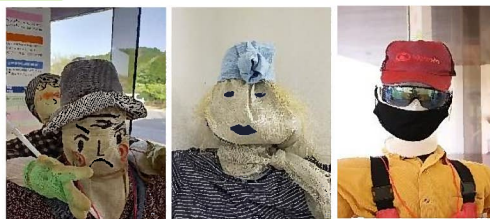
大賞に選ばれた3体