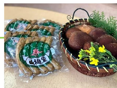
▲新商品：下山しいたけソーセージ 5本入り440円(税込)

手づくり工房 山遊里では、随時商品をリニューアルしていきますので、ご期待ください。