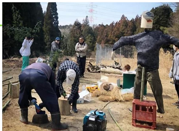
▲カカシ作り体験の様子

子どもも大人も実際にかかしを制作するのは初めての体験！「大変だったけど、いい体験ができた！また作ってみたい。」と大好評でした。