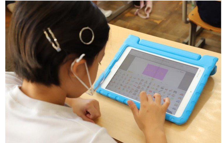
学習用タブレットの活用の様子