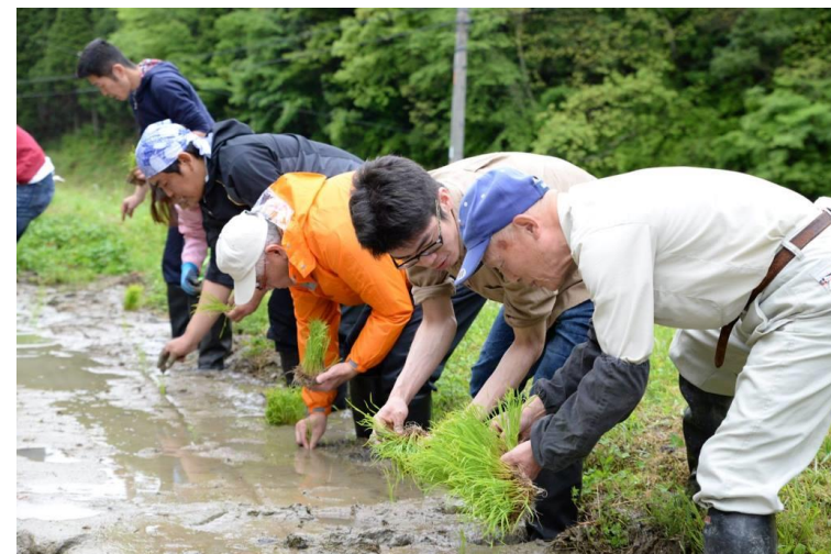
企業研修を兼ねた地元地域との「耕隆ファーム」