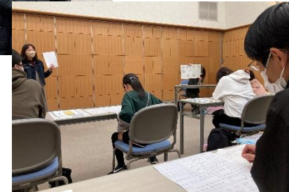
市民向け点字教室