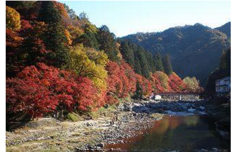
東海地方屈指の紅葉の名所「香嵐溪」