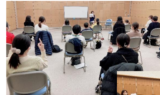
市民向け手話教室

「誰一人取り残さずに情報を伝える豊田市」、「配慮を必要とする人も自分の意思を伝えられる豊田市」を目指し、取組を進めていきます。ご支援いただける事業者様を募集しています。