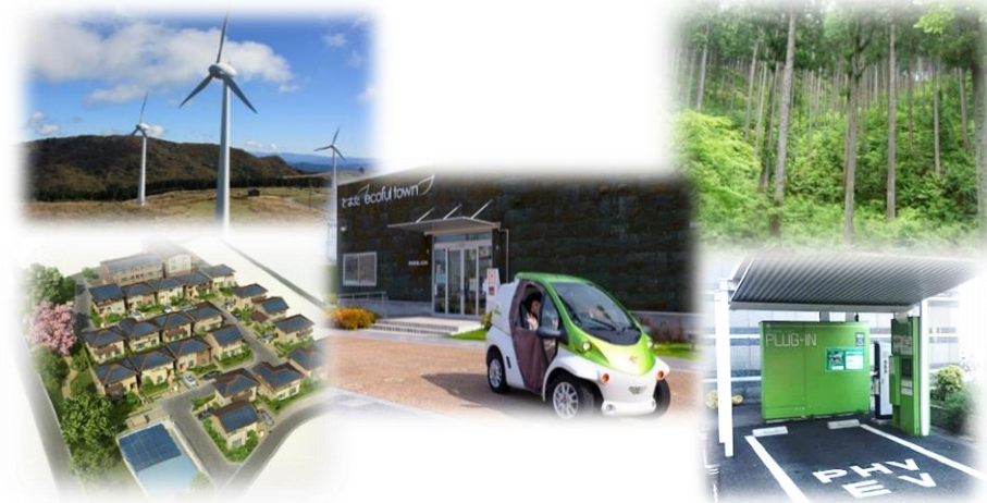
豊田市における脱炭素社会実現を目指した取組