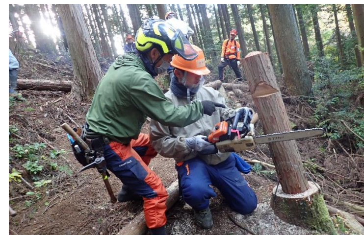
間伐ボランティア初級講座(豊田市主催)

森林環境教育・ボランティア活動支援事業は、持続可能な森づくりを進める上で、将来の森づくりの担い手育成として必要不可欠なものです。寄附でのご支援はもちろんのこと、社会貢献活動の一環として森林環境教育につながる講座等を実施いただける事業者も募集しています。ぜひ豊田市と共働で、持続可能な森づくりにチャレンジしませんか。