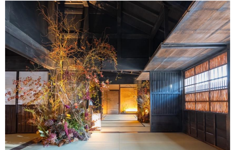
旧街道から見た旧鈴木家住宅の景観