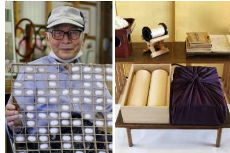
稲武の養蚕の様子と「繪服」