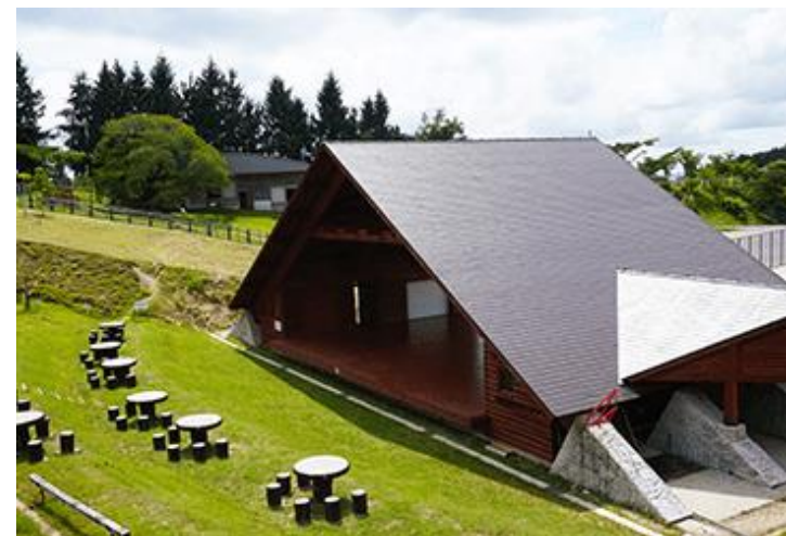
旭高原元気村 野外ステージ(整備か所ではありません)

世界最高峰のラリー競技、世界ラリー選手権 フォーラムエイト・ラリージャパン(WRC)の会場として使用するため、宿泊施設等を整備します。