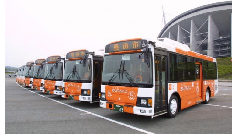
「おいでんバス」の写真