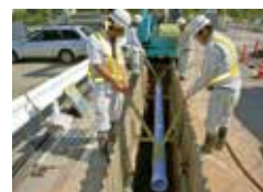
◀下水道管路工事の様子