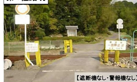
【遮断機なし・警報機なし】