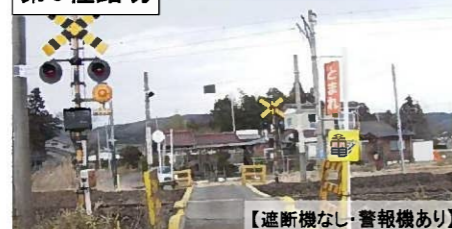
【遮断機なし・警報機あり】