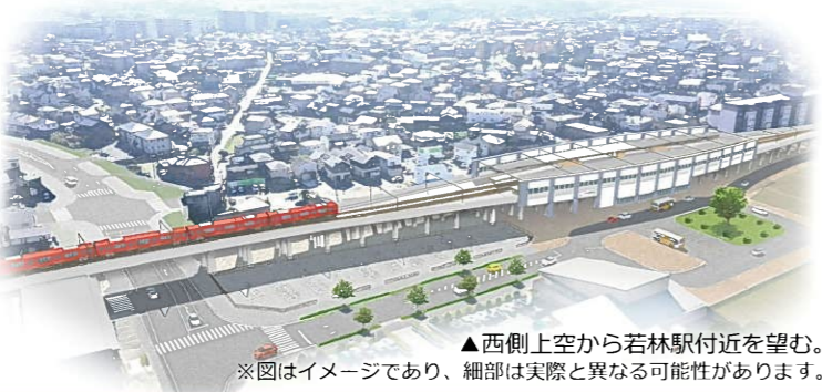
▲西側上空から若林駅付近を望む。 ※図はイメージであり、細部は実際と異なる可能性があります。

事業の進捗状況や予定についてご案内させていただくとともに、地域の方々をはじめとした市民のみなさまの疑問や関心にご答えする情報を発信していきますのでご一読いただければ幸いです。