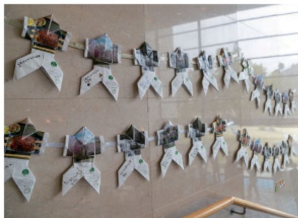
園児による「松平おりがみ」ガーランドの展示