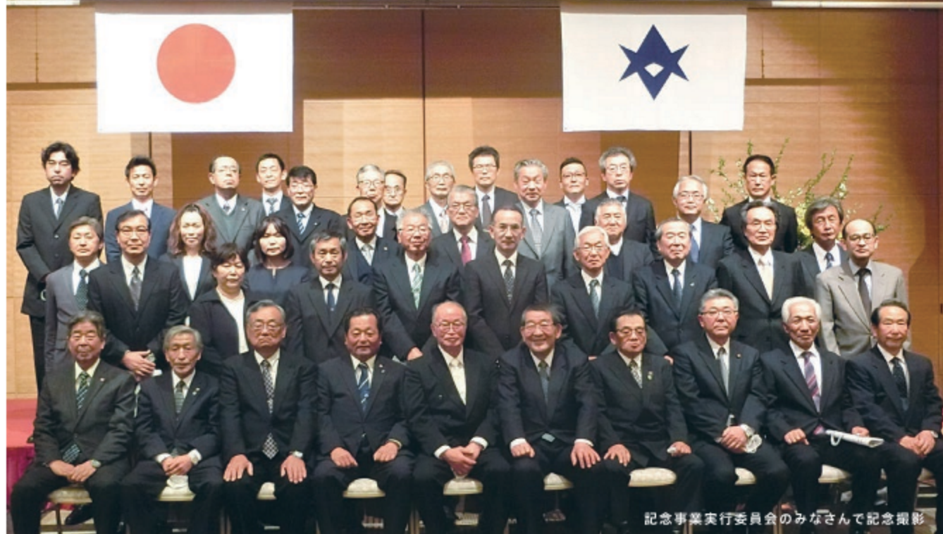
記念事業実行委員会のみなさんで記念撮影