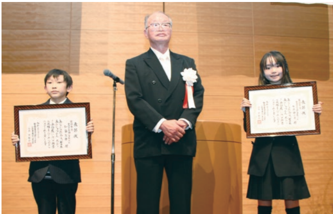
表彰状の授与後、中根会長と受賞者として記念撮影が行われた

こにいる小中学生の皆さんです。どうか力を貸してください。一緒に松平を元気にしましょう。」 この言葉で未来へ向けて開催した印象の式典となりました。 続いて太田市長から、「心豊かに暮らす基本は、各地域がアイデンティティや歴史文化をきちんと把握してまちづくりに活かすことです。松平はそのことに秀でた地区だと思っています。本日の記念式典は過去の歴史を振り返りかえるにとどまらず、50年後、100年後に向けて松平のDNAを子どもたちにどう伝えていくのかを確認する場でもあると思います。松平はぜひ豊田市の強力なパワースポットとして本市のまちづくりに力を発揮して頂きたい。子どもたちには、これか