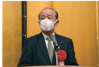
衆議院議員 八木 哲也氏