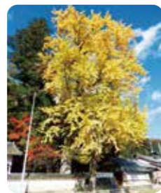
12 イチョウ(天神社) ☎ 281 632 583*57