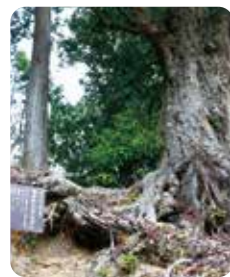
10 アカガン(八剣神社) ☎ 30 863 709*66