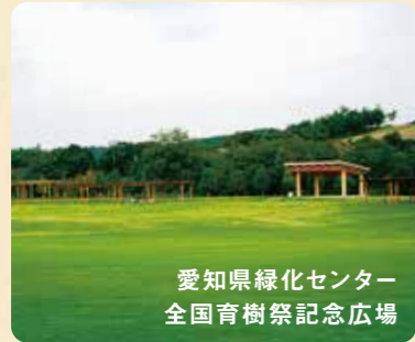
愛知県緑化センター 全国育樹祭記念広場