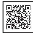
豊田市公共施設 予約システム