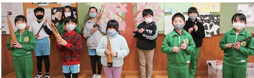
▲雅楽の練習をしていた3, 4年生

大沼小学校では、昭和60年から「世代を越えた地域の人々の交流やふるさとを愛する心の育成」を目的に、伝統芸能「大沼雅楽」の継承活動に取り組んでいます。