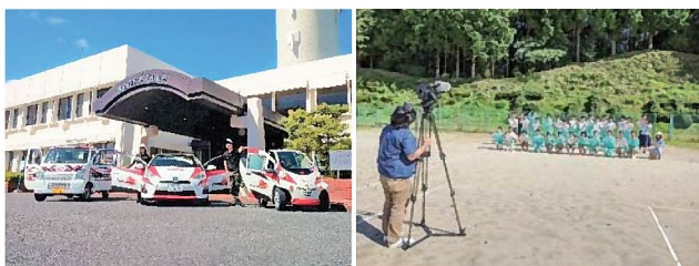
▲ラリー仕様ラッピングカーや、下山中学校の生徒も出演。

下山地区内の公共施設にもDVDを配付し、インターネットでも公開していますので、是非ご覧ください。