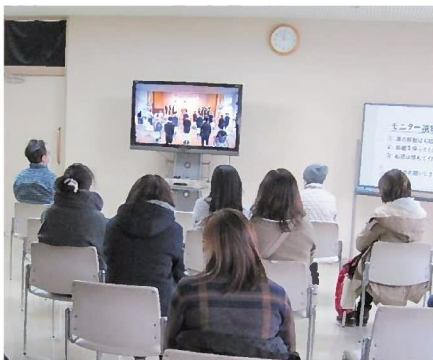
▲別室で式典の様子を見守る親族