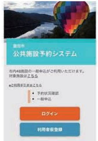
豊田市公共施設予約システム トップページ