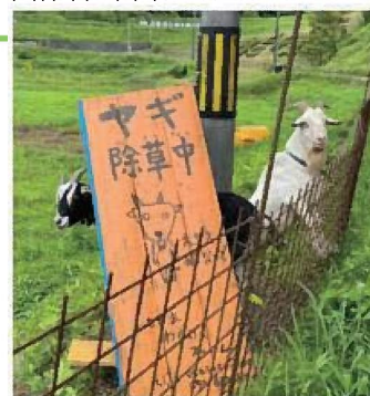
▲ヤギによるエコ除草