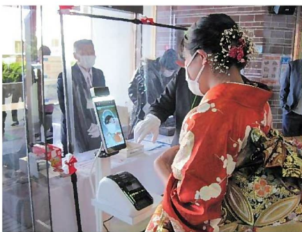
▲入口に設置した検温器