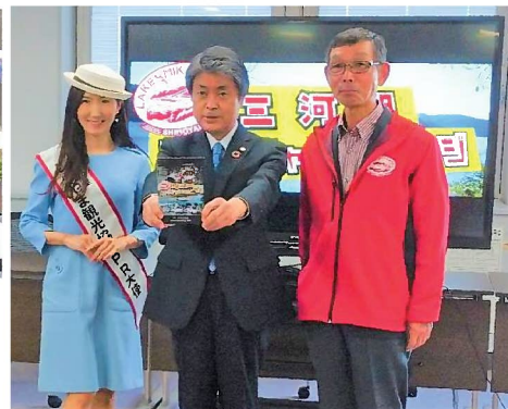
▲太田市長にもご覧いただきました。