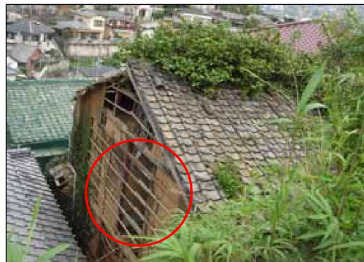
外壁が剥落し、著しく下地が露 出するとともに、壁体を貫通する 穴を生じている例