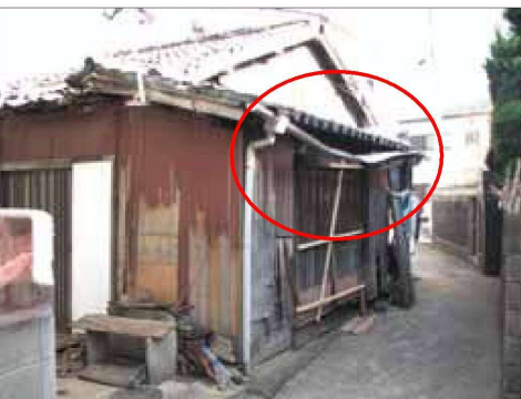
雨樋が壊れており、機能的には 雨樋はないと同様の例