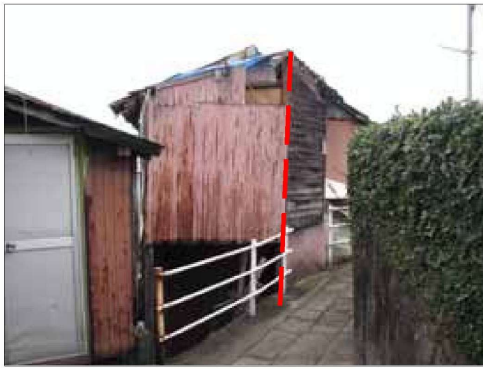
一部の柱が傾斜している例