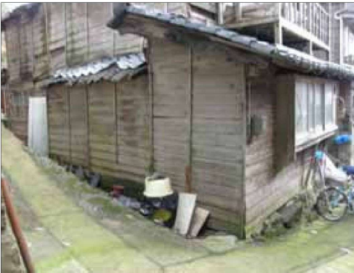
外壁が裸木造の例