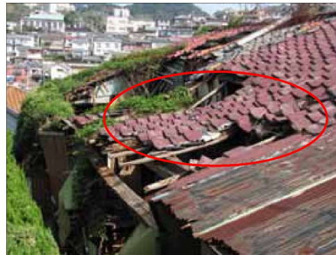
柱、はりの破損や変形が著しく崩壊の危険がある例