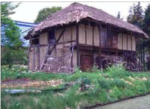
屋根材がワラの例