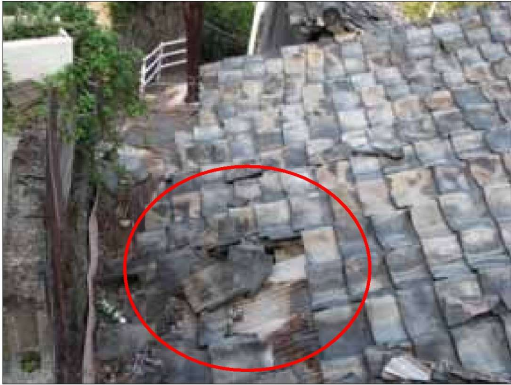
瓦の一部に剥離とズレがあり、 雨漏りのある例