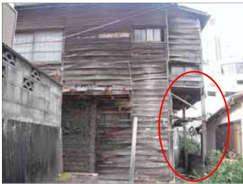
柱の数箇所に破損がある例