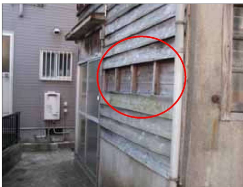
外壁の仕上材の一部がはがれ、 下地が露出している例