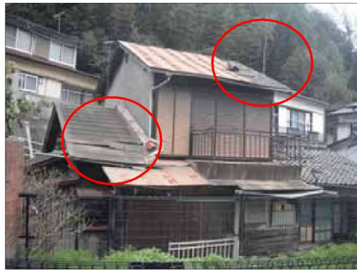
アスファルト屋根等の一部に ズレがあり、雨漏りのある例