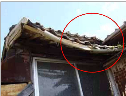
軒の裏板、たる木等が腐朽し、 軒が垂れ下がっている例