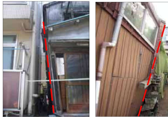
柱の変形が著しく崩壊の危険がある例