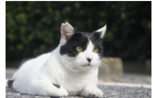
手術が済んだ地域猫