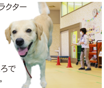
しつけトレーニングの様子(センター内のホールにて)