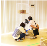
猫の譲渡会の様子

令和4年度もたくさんの犬猫に新しい家族が見つかりました。(犬12頭 / 猫184頭)