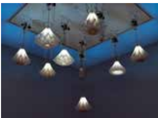
スタジオ・ドリフト《SHYLIGHT》2018