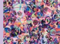
※参考画像 《Empty and Poke》2018