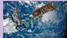
※参考画像 《一頭あるいは数頭のトラ》2017