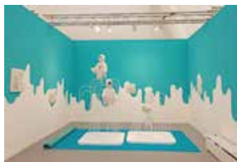
《Ascension Mark 1》2017 Copyright of the artist Courtesy of hunt kastner (Prague)