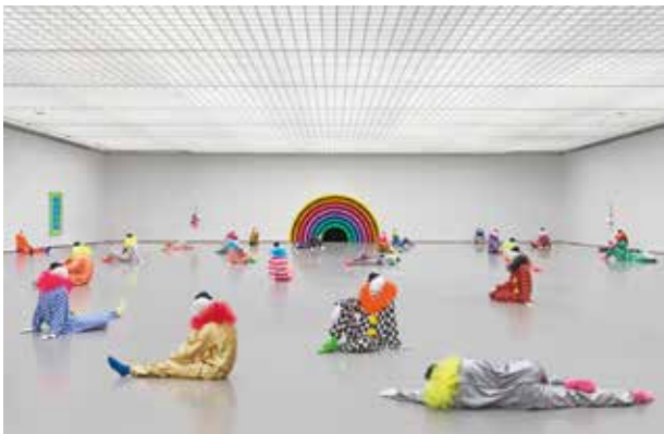
※参考画像 ウーゴ・ロンディノーネ 《孤独のポキャブラリー》2016 ホイマンス・ヴァン・ペーニンゲン美術館、ロッテルダム(オランダ) Courtesy of the artist and Galerie Eva Presenhuber, Zurich / New York

いつものまちを歩きながらアート鑑賞ができます。あわせてグルメやおもしろスポットも楽しみましょう！