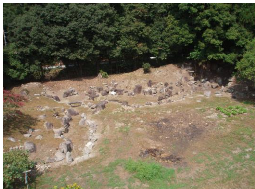
旧龍性院庭園現状風景