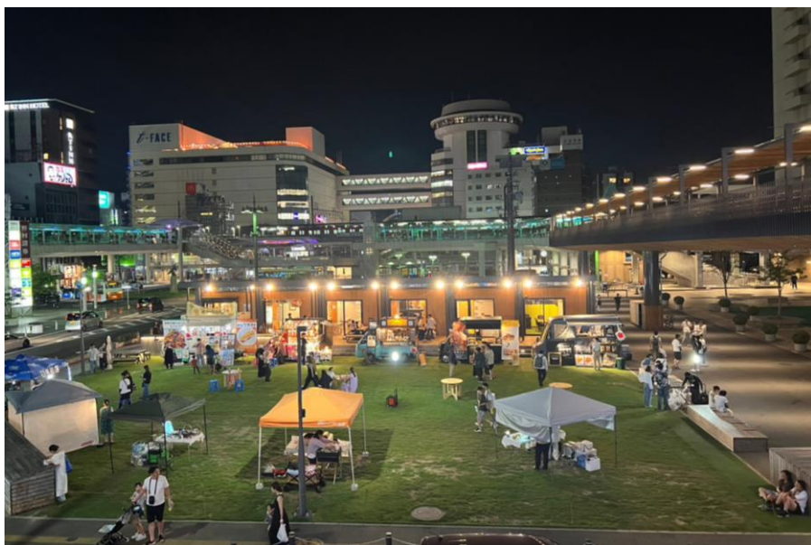
Toyota Street Marketの様子