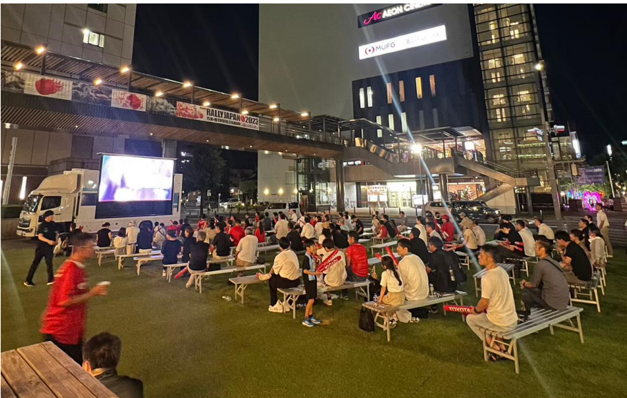
第94回都市対抗野球大会決勝パブリックビューイング