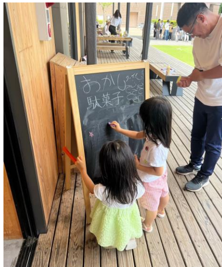
駄菓子屋の看板を思い思いにデコレーションする子ども達