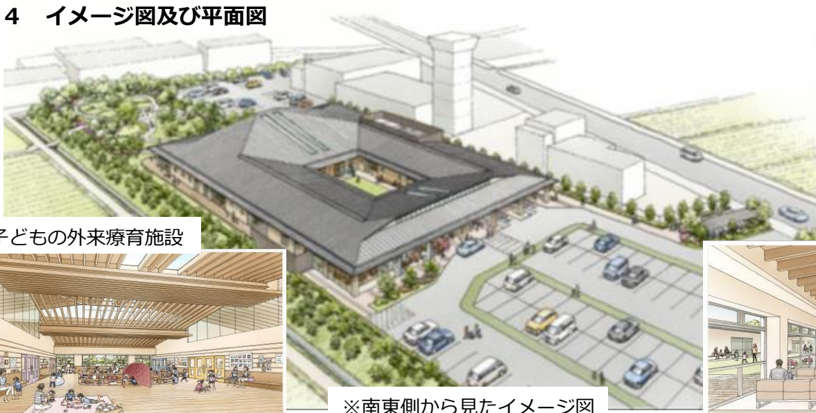
子どもの外来療育施設