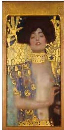
グスタフ・クリムト 《ユディットI》 1901年 油彩、カンヴァス 84×42 cm ベルヴェデーレ宮オーストリア絵画館