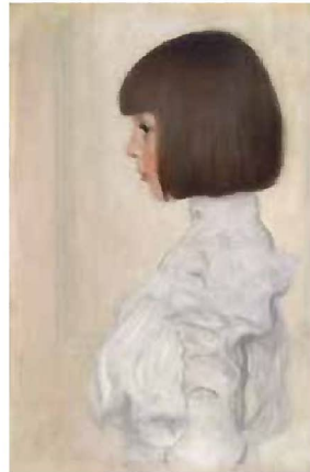
グスタフ・クリムト 《ヘレーネ・クリムトの肖像》 1898年 油彩、厚紙 59.7×49.9 cm 個人蔵 (ベルン美術館寄託)