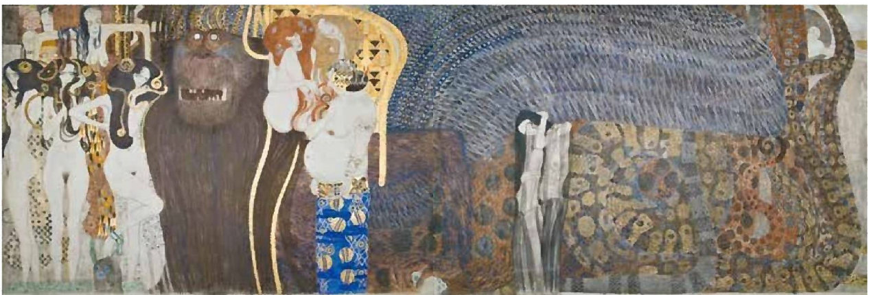
グスタフ・クリムト《ベートーヴェン・フリーズ》正面の壁「敵意に満ちた力」 1984年 (原寸大複製/オリジナルは1901-1902年、216×630 cm) ベルヴェデーレ宮オーストリア絵画館

クリムト ウィーンと日本1900 GUSTAV KLIMT Vienna-Japan 1900 展