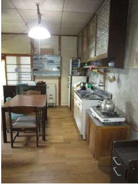
ダイニングキッチン