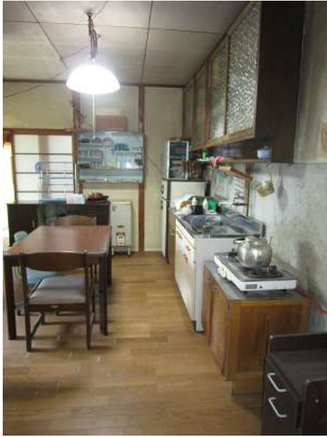
ダイニングキッチン