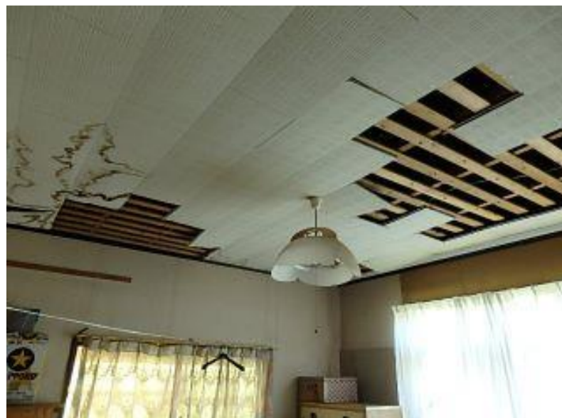
玄関脇 洋間 天井