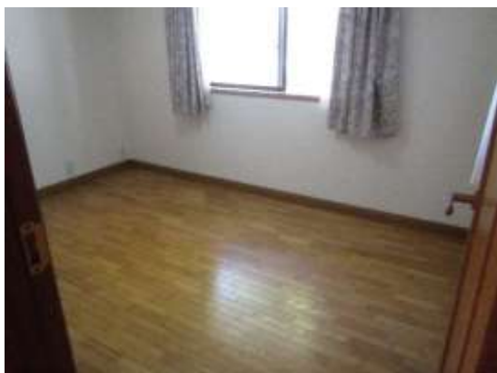
洋室 6畳 (2階)