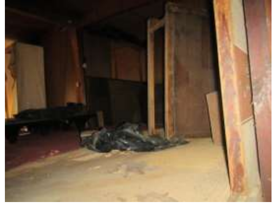
板間 (2 階)