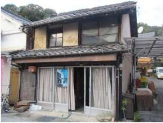
外観 (道沿い・伝建物)