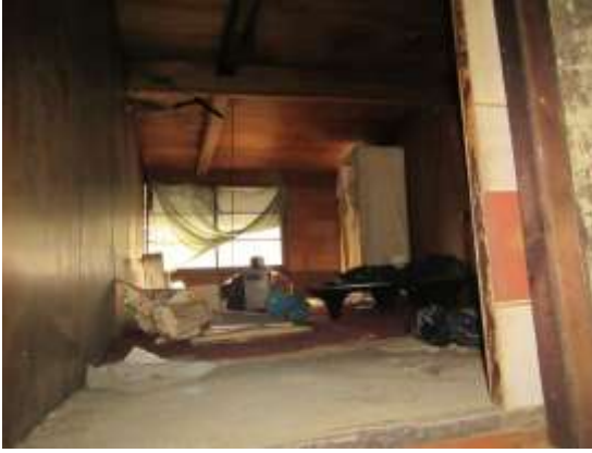
和室 4 畳半・板間 (2 階)