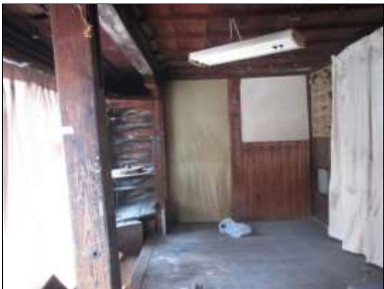
和室 3 畳