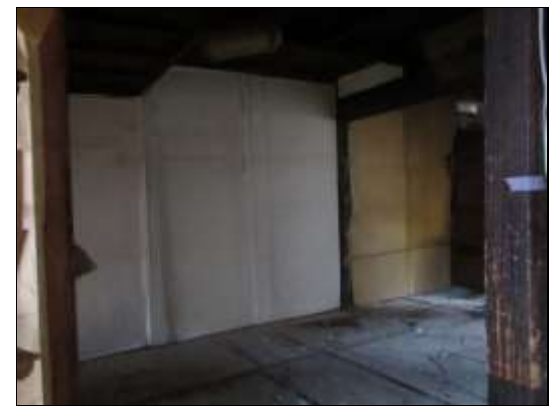
和室 6 畳