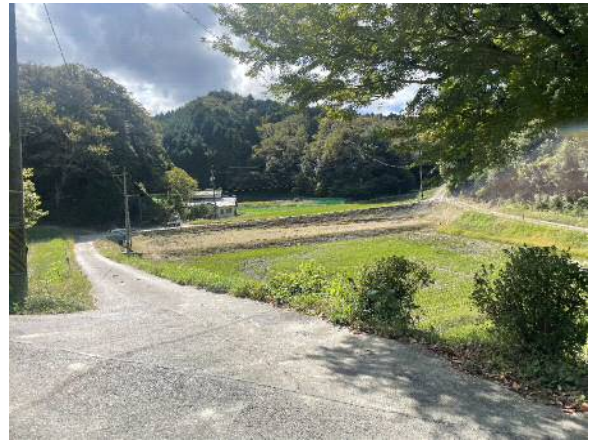
家から 600mの地点から家方向