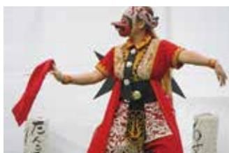
インドネシアの舞踊