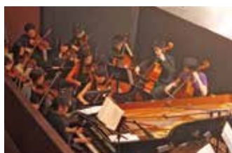
オーケストラの演奏