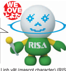
Linh vật (mascot character) (RISA)

Có cả ứng dụng "Ứng dụng phân loại và đồ rác/ tài nguyên" cho điện thoại thông minh! Hãy sử dụng nhé.