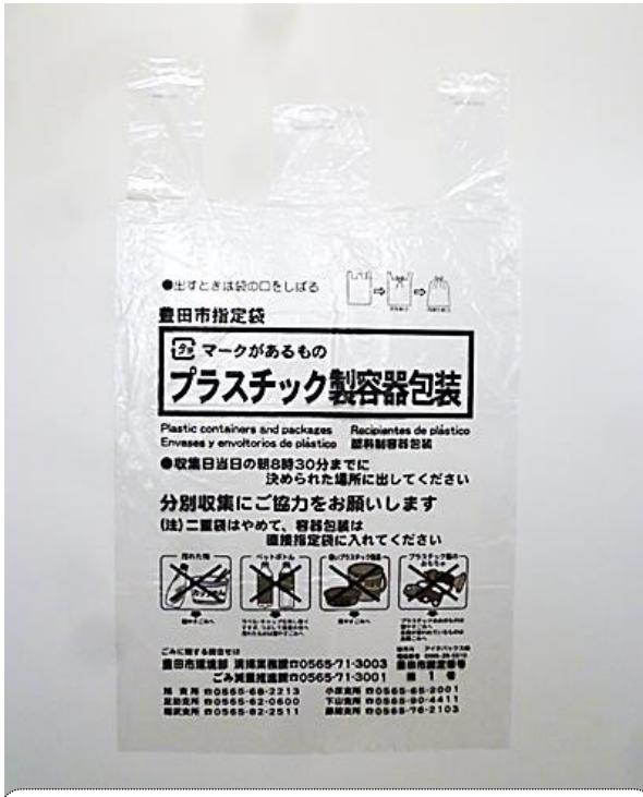
प्लास्टिकको कन्टेनर तथा प्याकेजहरू

तोकिएको फोहोर हाल्ने झोला मा हालेर झोला बाँध्ने। (指定ごみ袋に入れ、口をしぼる。)