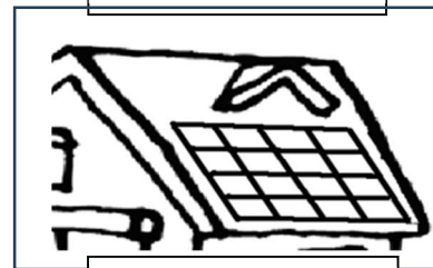
太陽光パネル写真イメージ