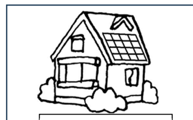
全景写真イメージ