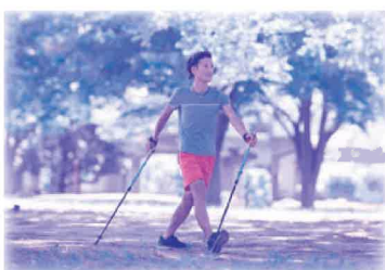
「ノルディックウォーク」