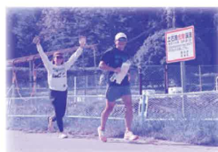
「オリエンテーリング」