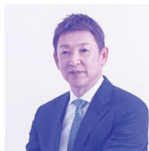
前中日ドラゴンズ監督 立浪 和義氏と いっしょにあるこう!!