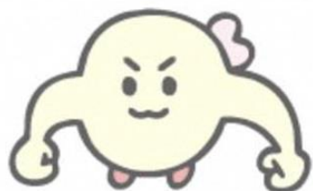
白血球のはっちゃん