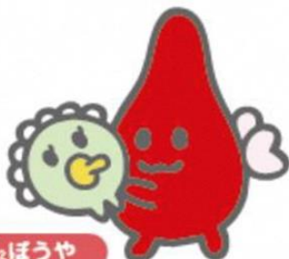
O 2 ぼうや