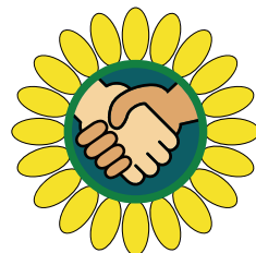
豊田市地域包括支援センター ロゴマーク