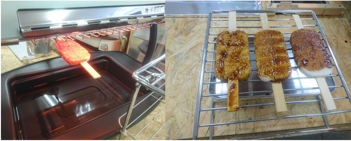
五平餅本焼き工程・完成品