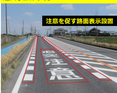
事例2 (主) 豊田一色線 (住吉町)