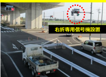
事例1 (主) 名古屋岡崎線 (中田町)