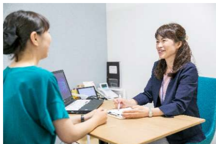
No.9 女性しごとテラス「カブチーノ」の設置