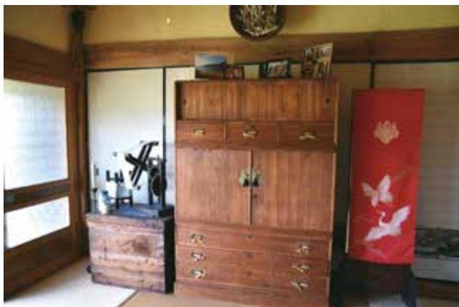
屋内のレトロな家具や道具