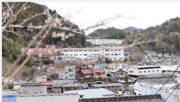
図書館からの景色

ここはとても見晴らしがいいので、ゆっくり景色を眺めるだけでも来てもらえると嬉しいです。