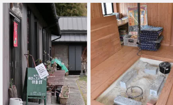
図書館入口付近と館内の囲炉裏