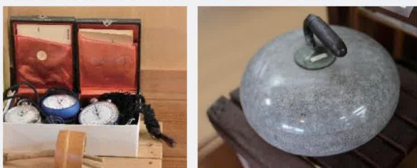
書籍とスポーツ用品