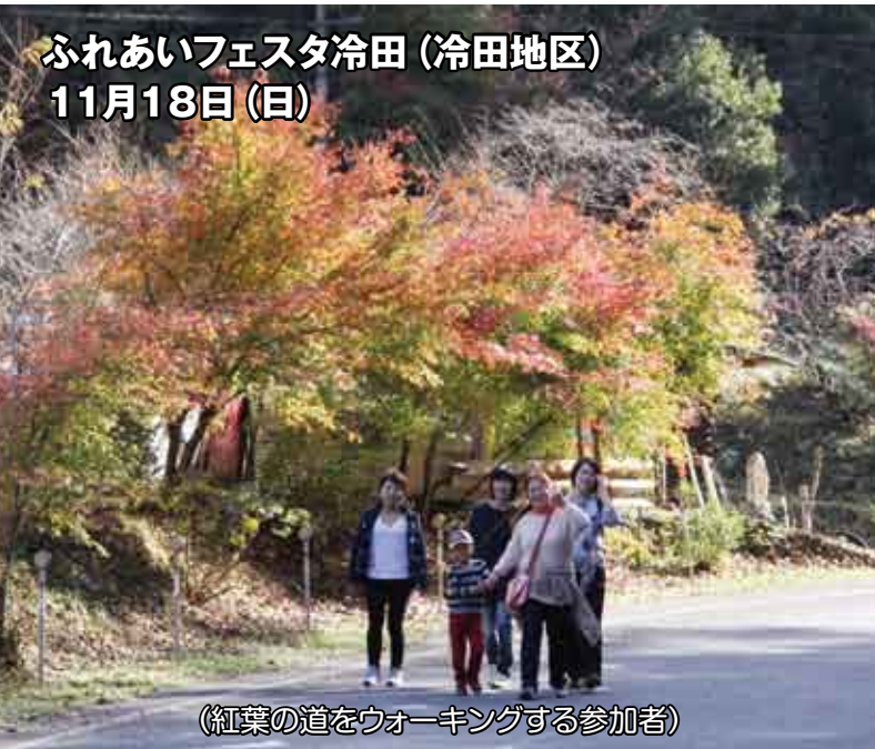
(紅葉の道をウォーキングする参加者)