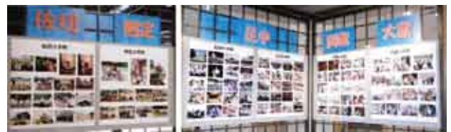
《なつかしい写真に当時はよみがえります!》

平成31年1月13日(日)の新成人を祝う会に向けて実行委員のみなさんが準備を進めています。ロビー談話室には小中学校時代の思い出が展示されています。