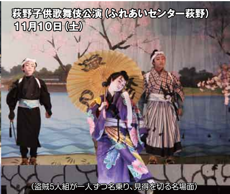
(盗賊5人組が一人ずつ名乗り、見得を切る名場面)

↑例年に比べ暖かな気候の中、ふれあいフェスタ冷田が開催され、約450人の参加者は、秋の景色を楽しみながらウォーキングをしました。ウォーキング後には、地元の方が作った豚汁やつきたての餅などが用意されており、中でも人気だったのが、冷田小学校の児童が作った五平餅で、あっという間に300本を完売しました。