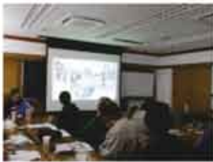
《ふれあいまつりを振り返って》

12月8日(土)に自主グループ代表者会を行いました。ふれあいまつりでの反省を共有したり、来年度の利用についての話を聞いたりしました。後半は豊田市防災対策課職員を講師に迎え「災害に備える」と題した講話を聴きました。