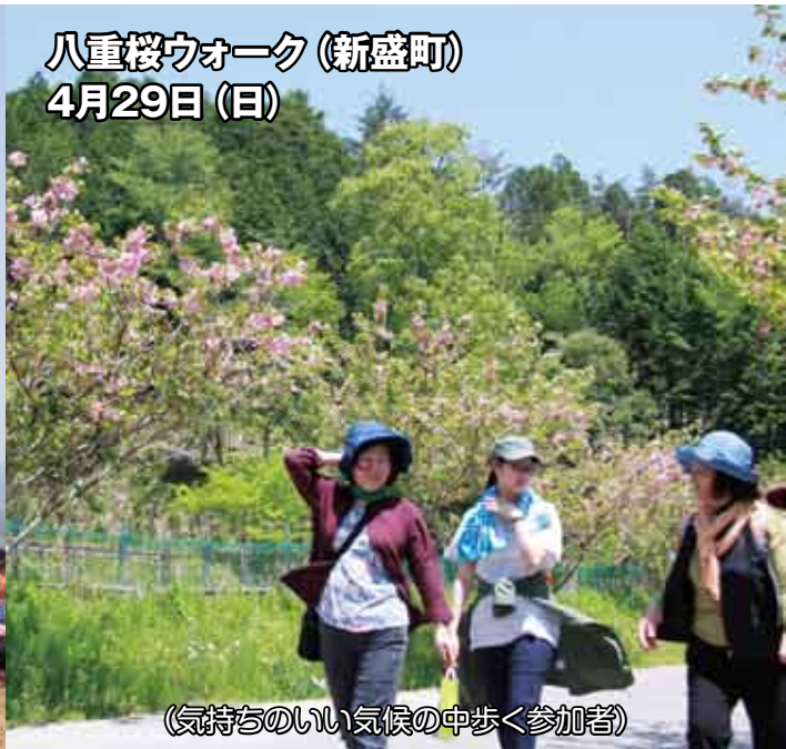
(気持ちのいい気候の中歩く参加者)

↑八重桜ウォークinすげの里が新盛町で行われました。約40名の参加者は、地元の方たちと一緒に約5.5kmのコースを歩き、自生している山野草の観察や郷土の歴史の話などを聞きながら、里山についての理解を深めました。今年は桜の開花が早く、満開の桜を見ることはできなかったものの、参加者は自然の中を歩き心身ともにリフレッシュした様子でした。