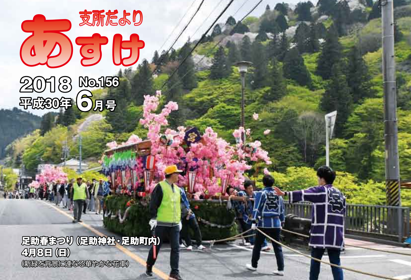
足助春まつり (足助神社・足助町内) 4月8日 (日) (新緑を背景に連なる華やかな花車)