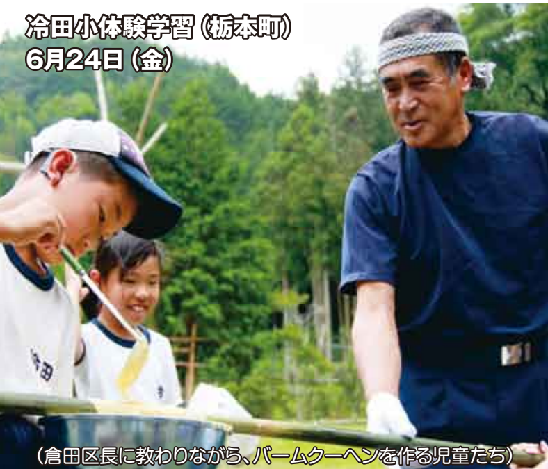
(倉田区長に教わりながら、バームクーヘンを作る児童たち)

↑「冷田の良さを伝える」ことを目的に、冷田小児童と倉田区長をはじめとした冷田自治区の方々との交流会が開催されました。今年で6年目を向かえ、冷田小の3、4年生計8人がバームクーヘンや竹ごはん、カレー等を作りました。子どもたちはそれぞれ目標を持ち、竹を切るところから料理を作るまで全て自分たちで行いました。