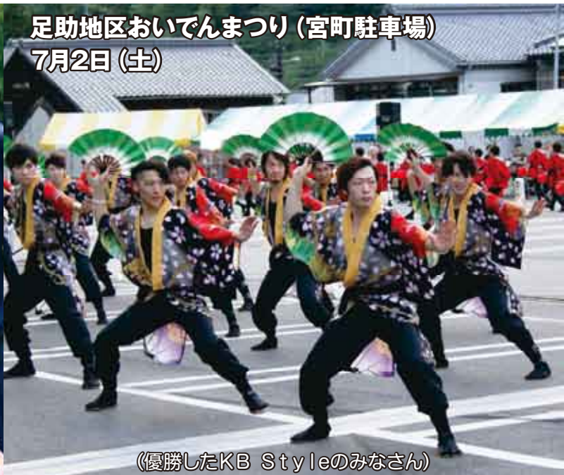
(優勝したKB Styleのみなさん)

↑今年では6つの踊り連(足助地区からは2連)が参加し、トヨタ自動車(株)に勤めている若手男性メンバーで構成されたチーム「KB Style」が、息の合ったオリジナリティーあふれるダイナミックな踊りで、見事優勝しました。会場に駆け付けた人は、各踊り連の個性的な衣装と踊りを楽しんで見入っていました。