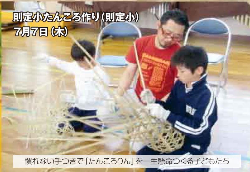
慣れない手つきで「たんころりん」を一生懸命つくる子どもたち