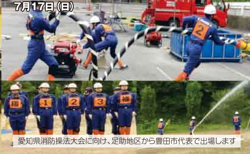
愛知県消防操法大会に向け、足助地区から豊田市代表で出場します