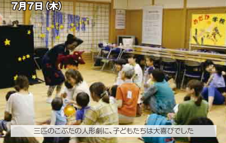
三匹のこぶたの人形劇に、子どもたちは大喜びでした