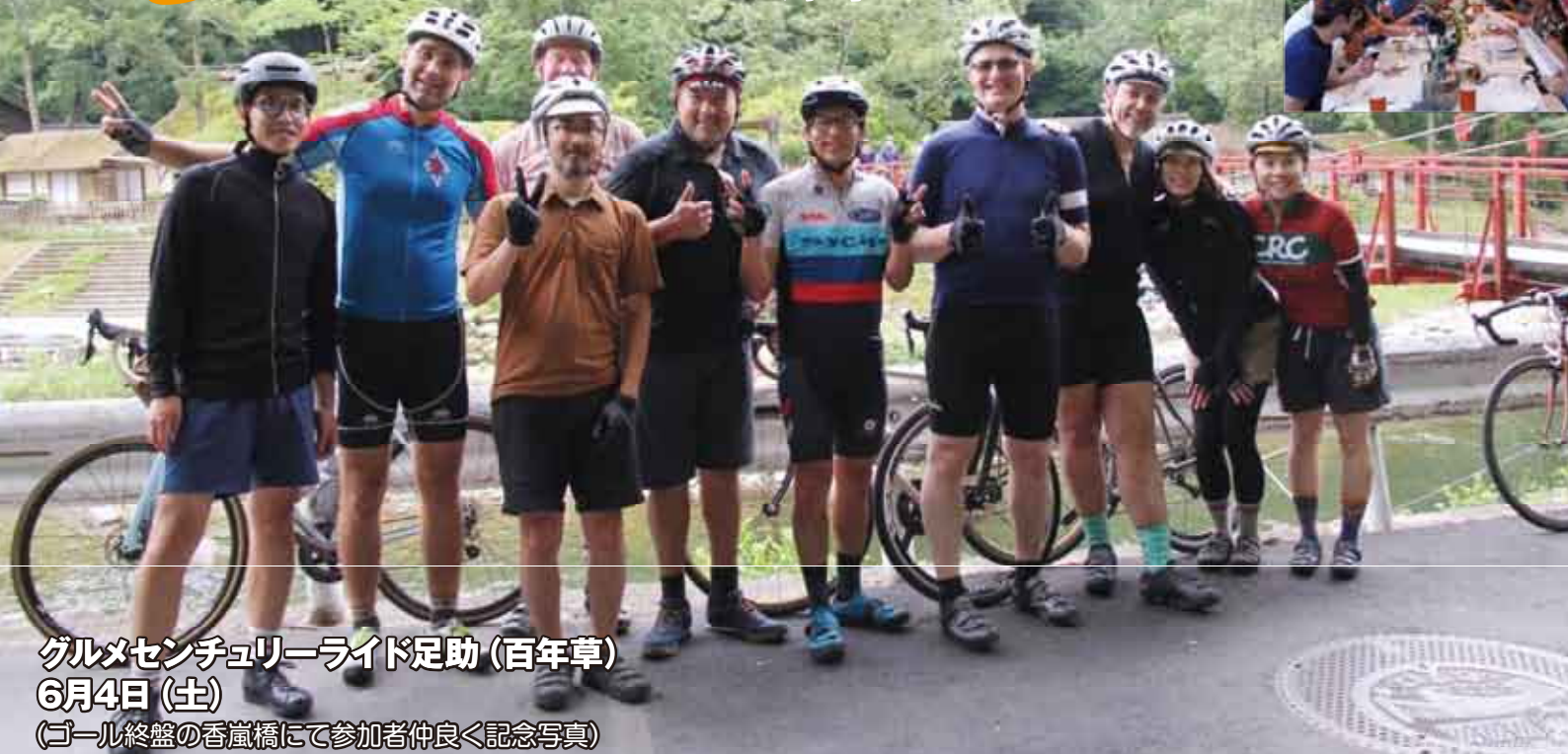
グルメセンチュリーライド足助(百年草) 6月4日(土) (ゴール終盤の香嵐橋にて参加者仲良く記念写真)

↑昨年に引き続き、「食と自転車」をテーマにした自転車のイベント「グルメセンチュリーライド足助」が開催されました。海外を含め全国各地から集まった約250人の参加者は、足助の豊かな自然あふれるコースや、休憩ポイントで提供されるランチや足助の和菓子などを楽しんでいました。上り下りの激しい約80キロのコースを走り終えた後は、地元食材をふんだんに使った一流シェフが作る豪華ディナーを堪能し、バンドが演奏する音楽が流れる和やかな雰囲気の中、参加者同士や運営を手伝ったボランティアスタッフとの交流を深めていました。