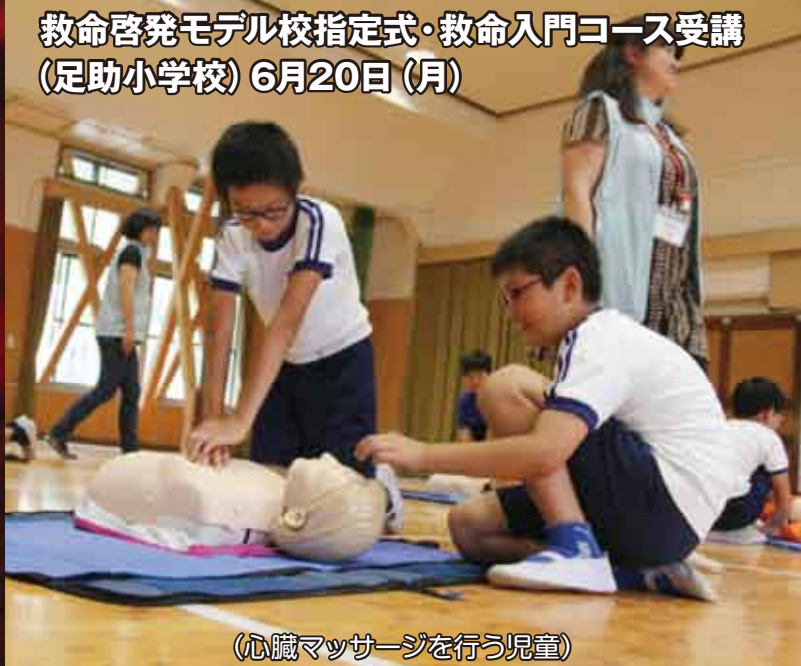
(心臓マッサージを行う児童)

↑省エネ啓発イベントに関係される、「たんころりんのキャンドルナイト」に今年は、竹灯りも一緒に登場しました。にわか雨が降るあいにくの天候でしたが、町かどでは三味線やフォークソングの演奏が響き渡り、多くの観光客が足を止めて聴き入っていました。「たんころりんの夕涼み」は8月6日～15日に開催します。