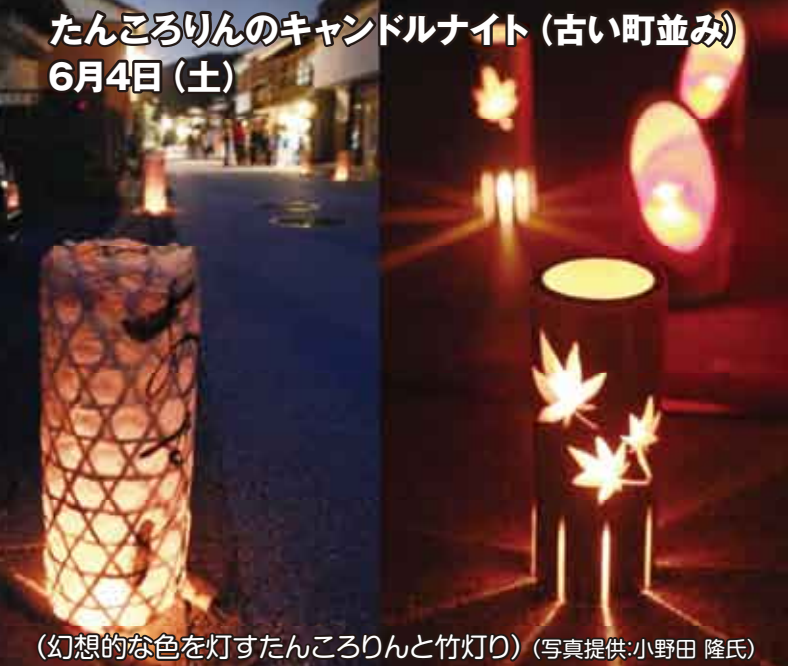
(幻想的な色を灯すたんころりんと竹灯り)