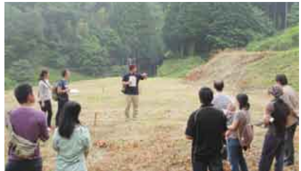
事業予定地で説明を受ける移住希望者

冷田地区で、2戸2戸作戦宅地分譲事業の現地説明会と交流会が行われ、5組の移住希望者が参加しました。説明会後の交流会では、地域住民が作った豚汁を食べながら和やかな雰囲気で見聞交換をしました。今後も定住希望者に地域を理解してもらうため、交流会を続けていきます。