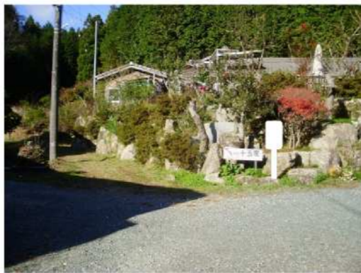
<新設>デイリー花沢店