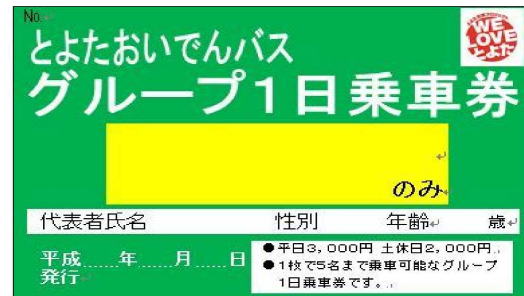
○乗車券の券面イメージ（案）