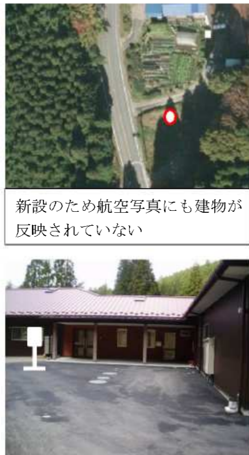
<新設> (仮) 阿蔵石原