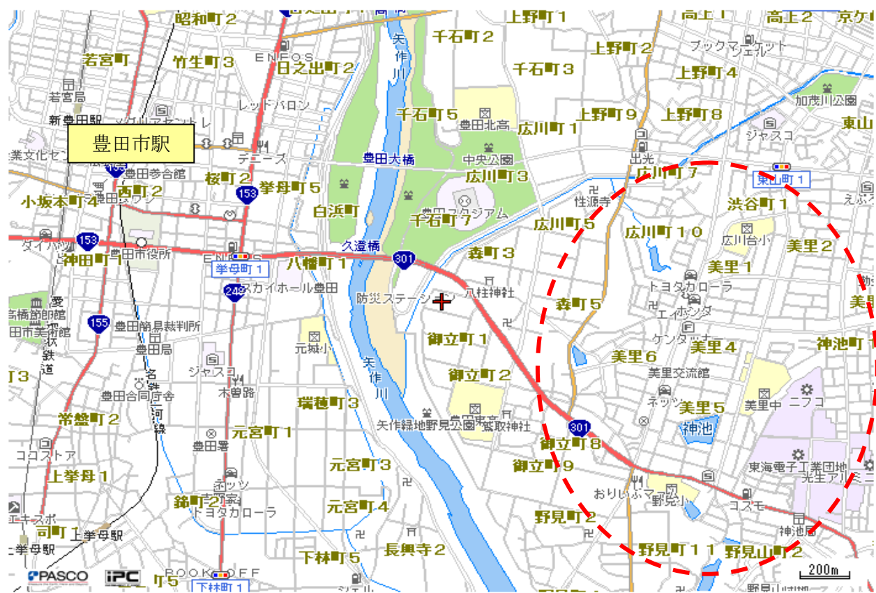
図 東豊商店街の位置

平成27年度の東豊商店街振興組合の組合員数は、19店舗であり、物販7店、飲食3店、サービス9店となっています。