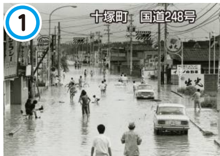
昭和47年7月豪雨 中心市街地周辺の浸水状況