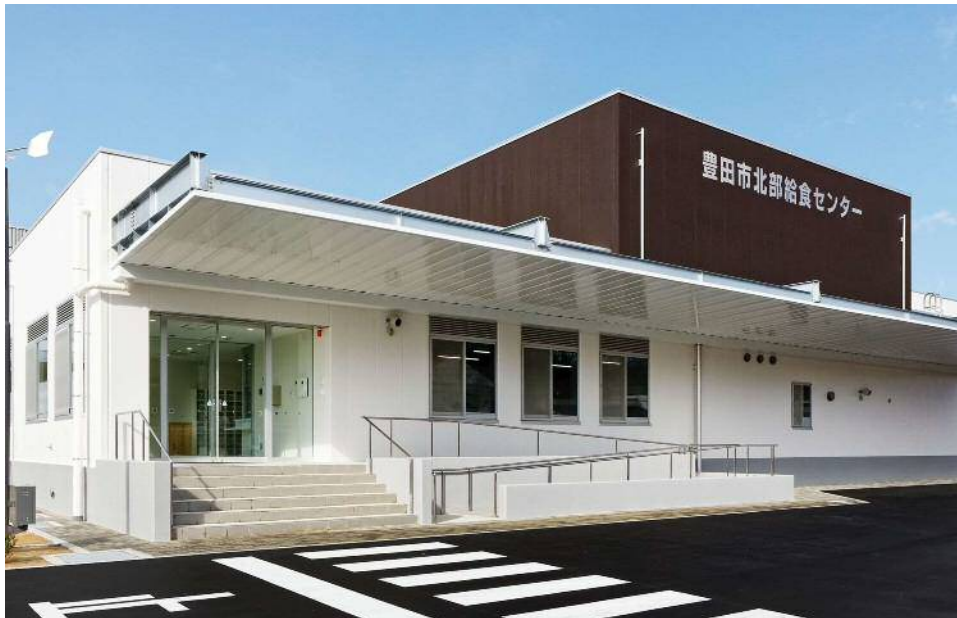
北部給食センター