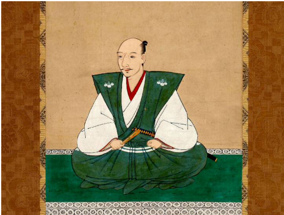
重要文化財 紙本著色織田信長像 長興寺蔵