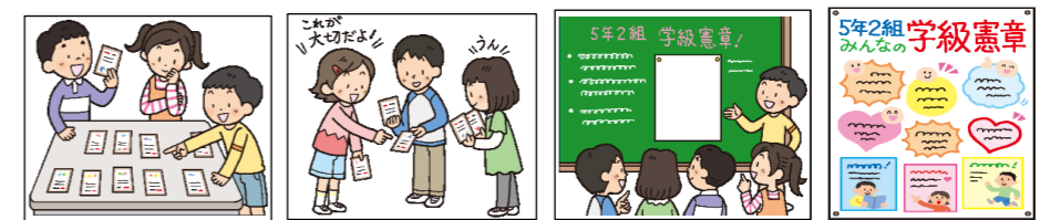
子どもの権利が守られた学級づくり | Child Rights Education | 日本ユニセフ協会

先生方におかれましては、教育実践の中でどんなことができそうかを検討していただき、どうすれば子どもたちが子どもの権利に気づき、どうすればこれを通じて自分と自分以外の他者の尊厳・大切さにも気づいていけるのか、そんな教育実践を心から期待しています。