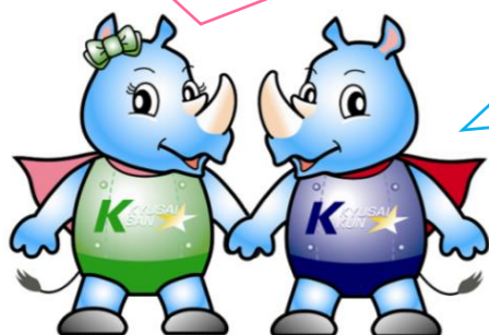
キョウサイさん・キョウサイくん とよた子どもの権利相談室 マスコットキャラクター