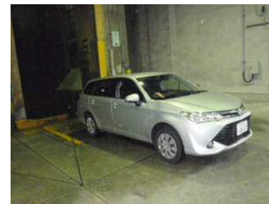
③-1 一般ごみ(破碎が不要なもの)