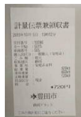
計量伝票兼領収書