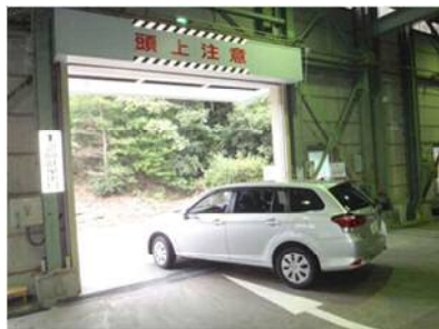
入口から見て左側の出口