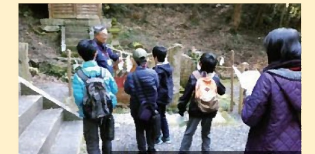
歴史さんぽ (10月) ※イメージ