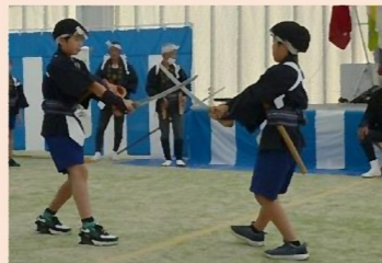
わくわくフェスタ (11月)