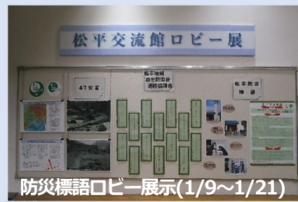
防災標語ロビー展示(1/9~1/21)