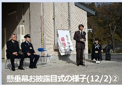
懸垂幕お披露目式の様子(12/2)②