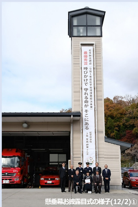
懸垂幕お披露目式の様子(12/2)①