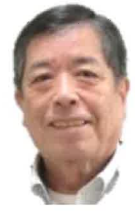
第10期 富重副会長 (大林町)

10期の地域会議が動き始めてすぐに「南海トラフ地震臨時情報」が発令されて、本当に大災害が起きるんじゃないかと怖かったよね。