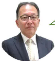
杉坂委員（豊栄町一区）

それってみんな知っているのかな。そもそもどうやって避難所運営するか知ってる人いる？