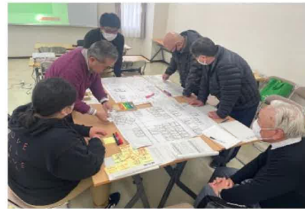
地域会議委員がHUGを体験している様子

避難所運営って言われても、イメージがわからないね。「避難所運営ゲーム(HUG)」を使って避難所運営を体験。