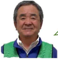
大内委員（豊栄町一区）