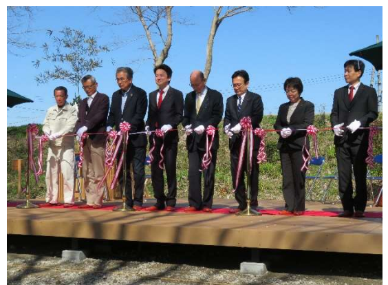
👉 テープカットの様子